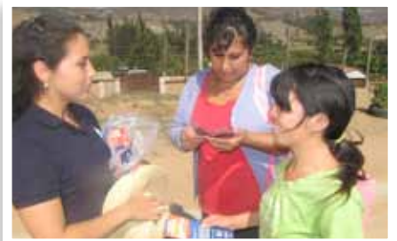
Seguridad Ambiental Campaña Buen Uso del Alcantarillado - Asiento Viejo.