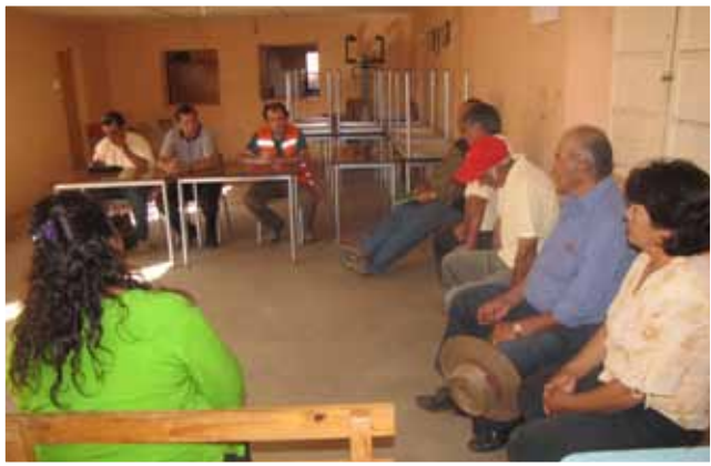
Servicio Público Vialidad en reunión con junta de vecino.

Desde la coordinación de las acciones de habilitación laboral a mujeres participantes en Programa de Empleabilidad y Microemprendimiento de PRODEMU. Hasta el Mejoramiento de la focalización de las actividades del Gobierno en Terreno en localidades especialmente con carencias identificadas en bases de datos públicos, para reforzar la equidad territorial, todo consensado dentro del CTA.