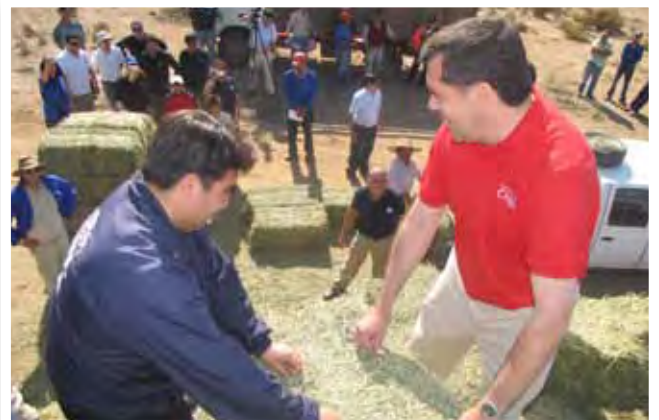
Indap – Emergencia Agrícola.