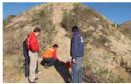
Fiscalización de Relaves