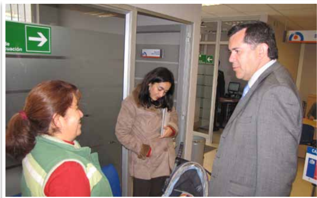
Fiscalización de pago Ingreso Ético Familiar - Illapel