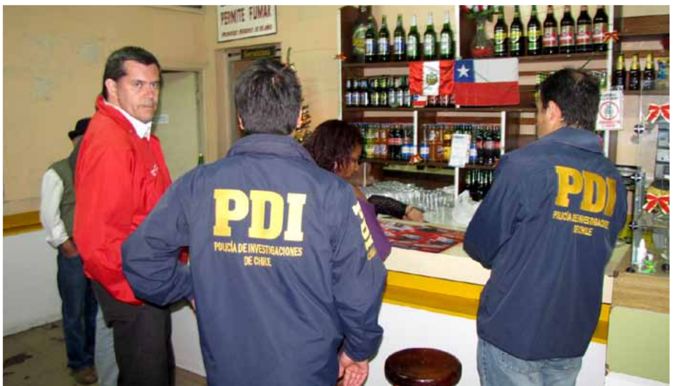
Inspección de locales nocturnos