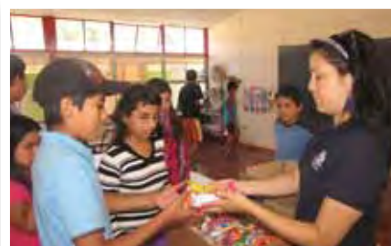
Seguridad Pública - Escuela de Verano - Illapel.