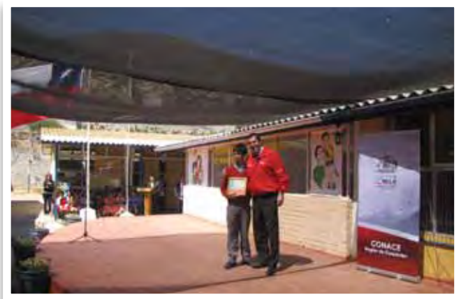
Convenio CONACE Escuela Canela Alta.