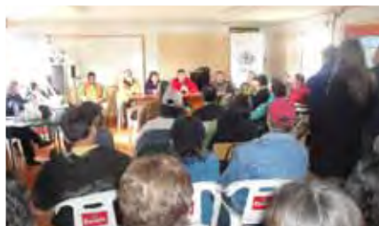
Tilama - Comuna de Los Vilos 27-07-2010 200 beneficiados