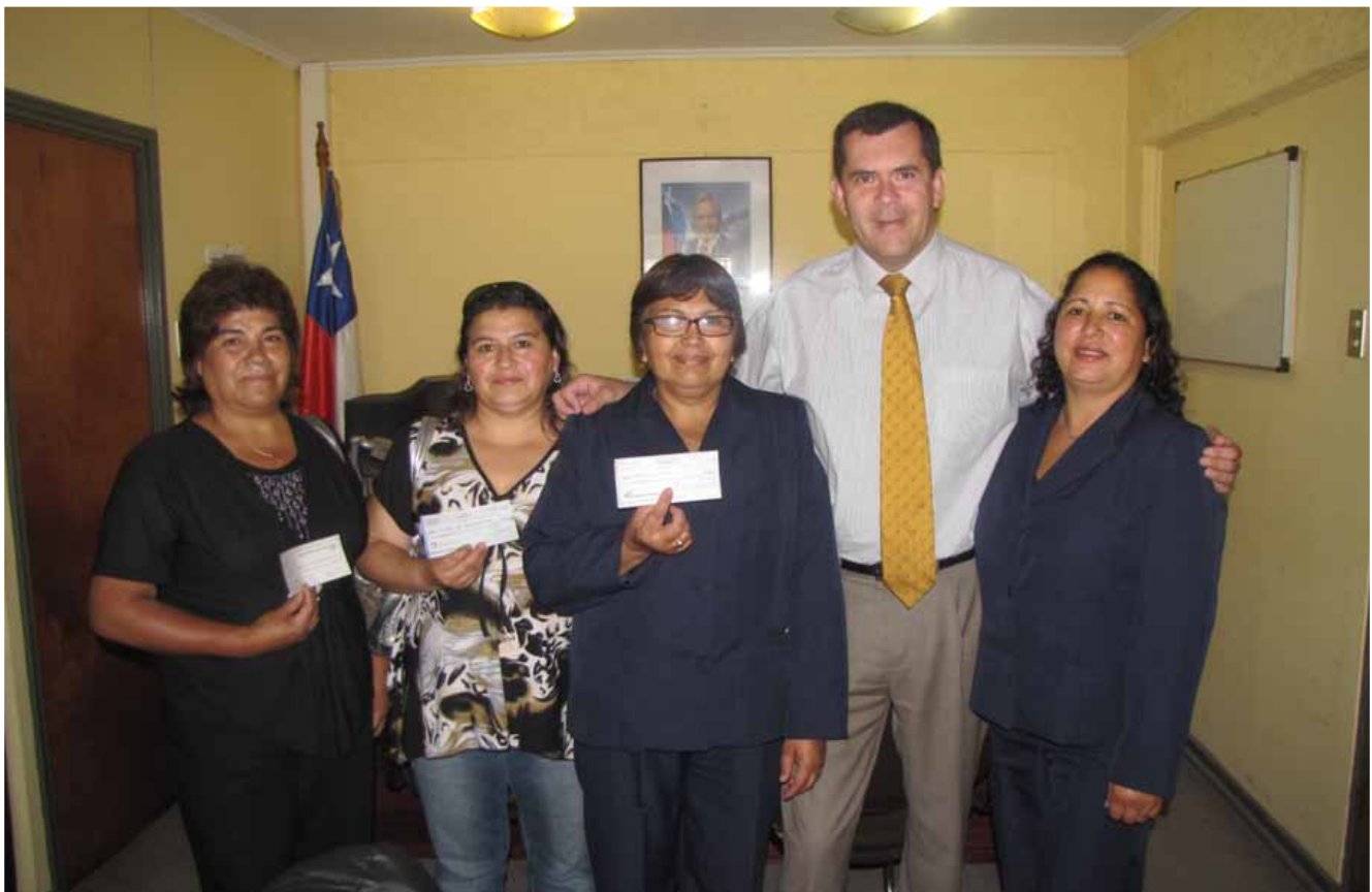
Entrega de fondos sociales Junta de Vecinos La Aguada 1 – Centros de Padres y Apoderados de Illapel – Agrupación “Amigos del Silencio” de Salamanca.