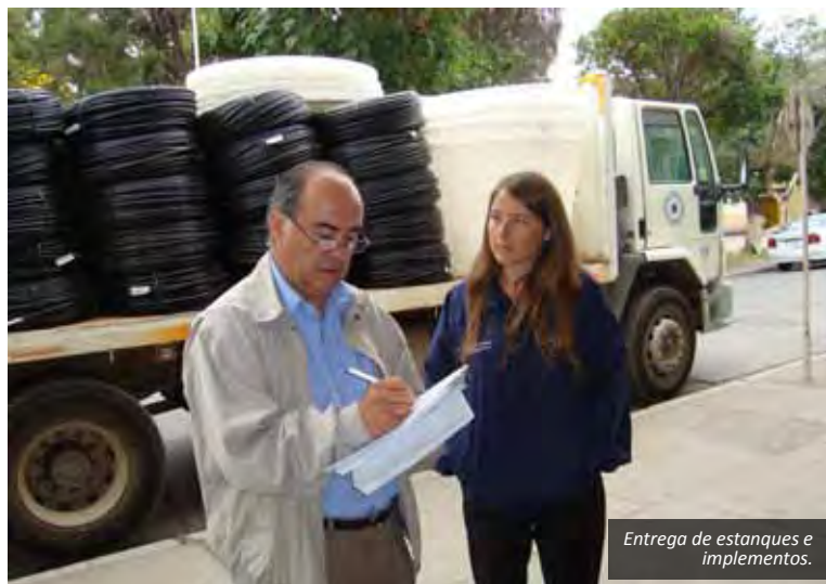
Entrega de estanques e implementos.