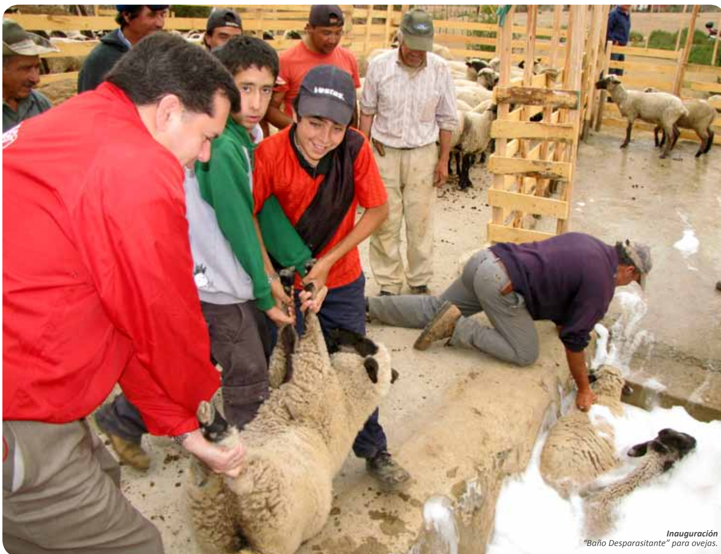
Inauguración "Baño Desparasitante" para ovejas.