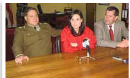
Seguridad Pública - Solicitud mayor dotación de Carabineros.