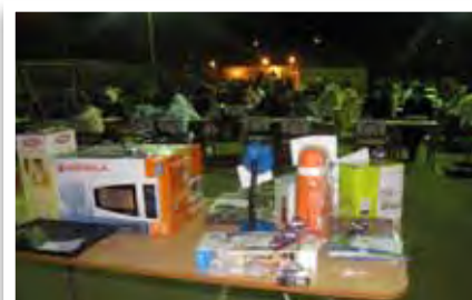
Seguridad Pública - Bingo Los Vilos.