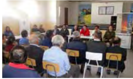
Canela Alta - Comuna de Canela 07-09-2010. 600 beneficiados