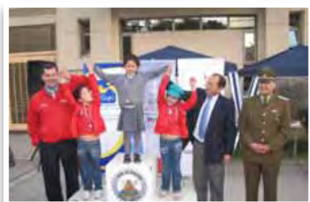
Premiación Corrida Chile Seguro