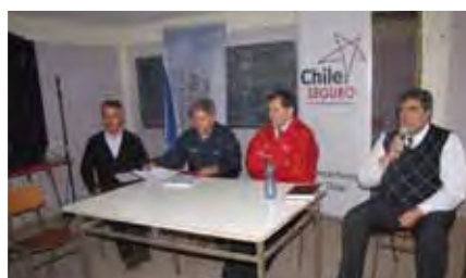
Cañas de Michio - Comuna de Illapel 06-05-2010 200 beneficiados