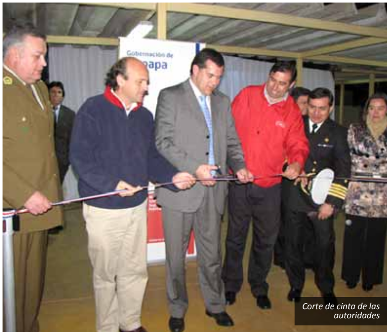
Corte de cinta de las autoridades