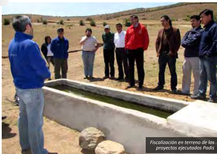
Fiscalización en terreno de los proyectos ejecutados Padis