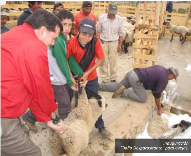
Inauguración "Baño Desparasitante" para ovejas.