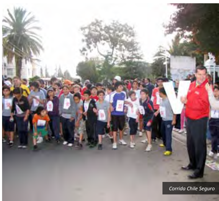
Corrida Chile Seguro