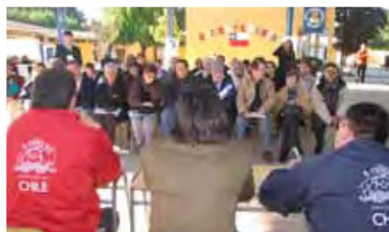
Caimanes - Comuna de Los Vilos 13-01-2010 200 beneficiados