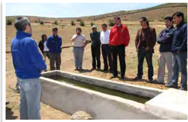
Proyectos PADIS Inspección en terreno.

Esta orientado a la atención de los campesinos que se encuentran en mayor grado de vulnerabilidad socioeconómica. Tiene como fin contribuir al mejoramiento de sus condiciones de vida, a través del fortalecimiento de la base productiva y comercial de sus actividades silvoagropecuarias, conservación de su entorno ambiental y participación ciudadana de hombres y mujeres.