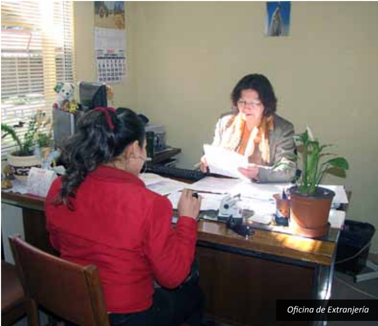
Oficina de Extranjería